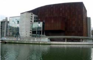
Palacio Euskalduna, sede del IX Simposio de empleo con apoyo

En nuestra página web encontraréis una primera propuesta del programa, y una invitación a todas aquellas personas y entidades que deseen asistir al simposio. Además, todas aquellas entidades o servicios que quieran participar dando a conocer sus experiencias en materia de empleo con apoyo, ya sea mediante comunicaciones, paneles, etc., pueden aprovechar esta ocasión enviando sus propuestas a la AESE.